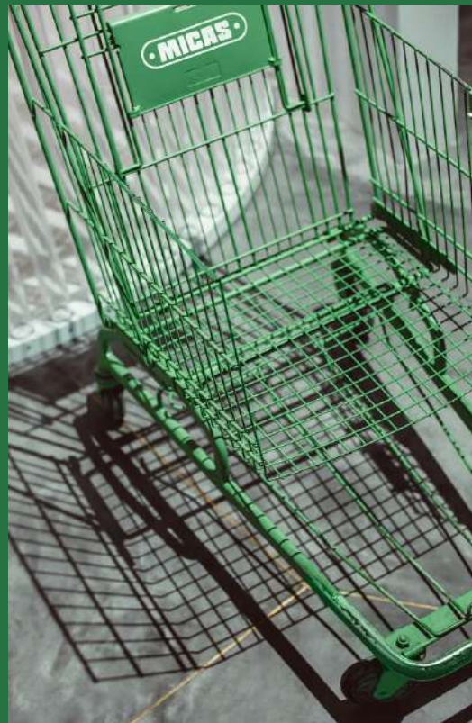
Carrinho de compras