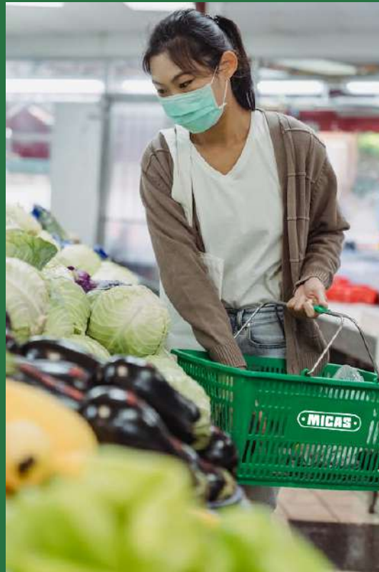
Cesto de compras