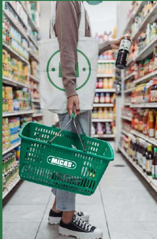
Saco e cesto de compras